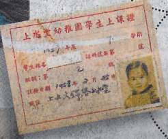
呢張中華基督教會上水堂幼稚園嘅上課證，寫住1957年度，好有紀念價值。（曾憲宗攝）

呢款水壺風靡1960、70年代，價錢相宜又輕身，仲有條帶可以斜揸，可謂幼稚園生必備。（曾憲宗攝）