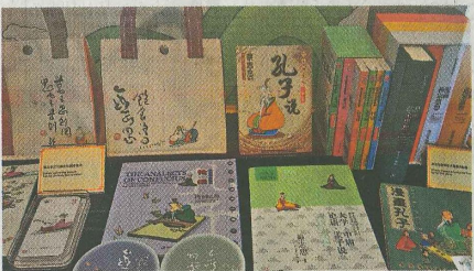
展品中有不同類型的圖書及刊物。

教育博物館也特別為是次展覽開發了多個互動遊戲，初小學生已可試玩，如「畫中論語、話中論語」結合圖像與文字的配對；「成語大挑戰」要用鑰字模擬擬著在熒幕跌下來的成語句子，其他工作坊及遊戲還有投豆及托印畫等，內容涵蓋六藝：禮、樂、射、禦、書、數，「目的都是帶出更多互動元素，在展示上能更活潑、年輕化，也希望參觀者日後有與趣接觸不同展覽，多逛博物館。」