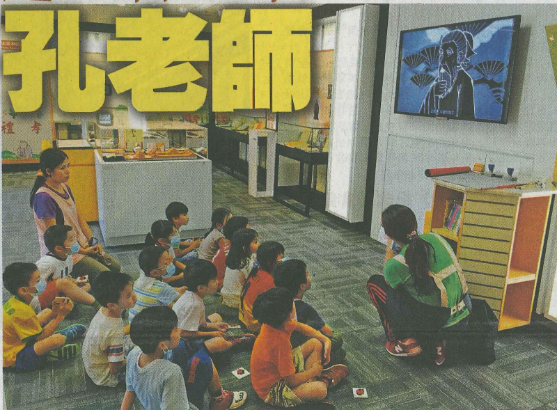
導賞活動的除了博物館的工作人員，也有教院學生由導賞師帶領參觀者親近傳統文化。