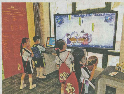
同學正進行「仁義禮智信孝成語大挑戰」。

「孔子是教育家、哲學家，其思想不單影響華人社會，在日本、韓國、越南等地，也有其教育的傳承。」