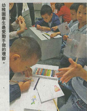
幼稚園學生最愛動手做的環節。